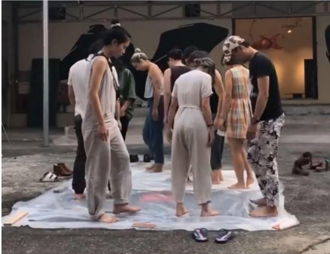
Meeting through iterative gestures of felting. Other contexts, other encounters